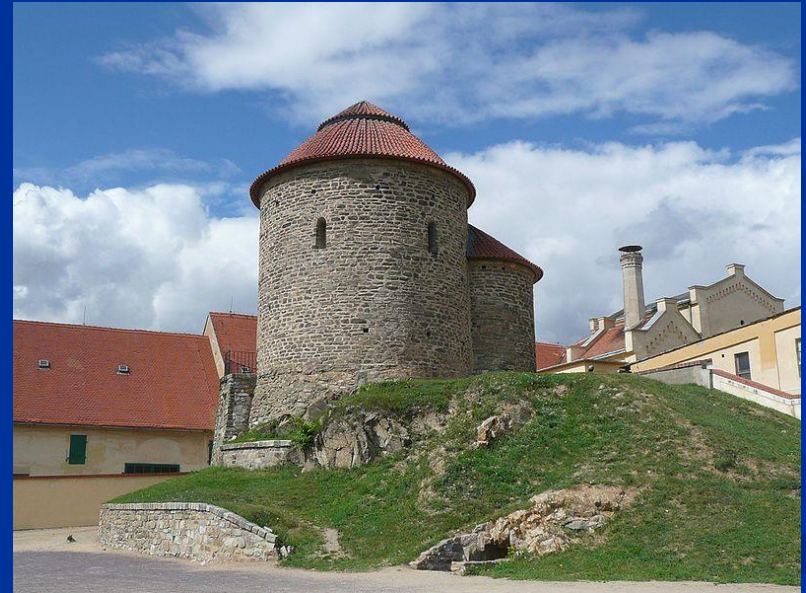
Rotunda sv. Kateřiny ve Znojmě (11. stol.)

Blanulak [cit. 2013-3-9]. Dostupné pod licencí Public domain na www: http://cs.wikipedia.org/wiki/Soubor:RotundaRip.jpg