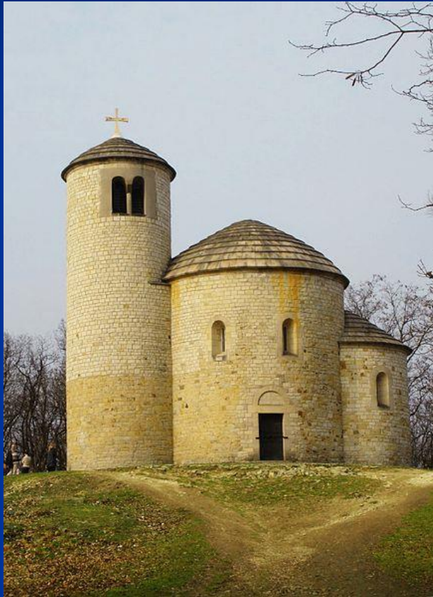
Rotunda sv. Jiří na Řípu (11. stol.)