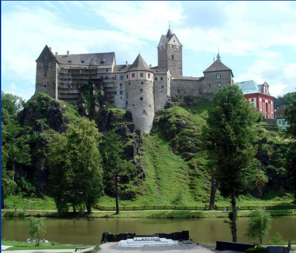
■ Hrad Loket